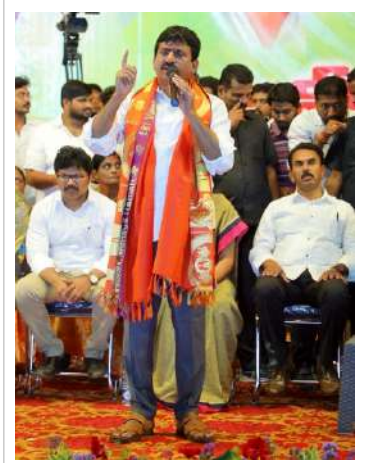
మొత్తం ఎదురుదూస్తుంది కొత్తగూడెం వేదికగా తిరుగుబాటు మొదలైందని హెచ్చరించారు.

ముఖ్యమంత్రి అవుదామని కలలు కంటున్నావు అది సాధ్యం కాదు అని గుర్తుపెట్టుకో. రైతులకు లక్ష రూపాయల రుణమాఫీ అన్నావు,దళిత బంధు పేరిట దళితులను మోసం చేస్తున్నావు,దళితులకు మూడు ఎకరాల భూమి అన్నావు ఎంతమందికి ఇచ్చావని నేను ప్రశ్నిస్తున్న నీ దగ్గర సమాధానం ఉండా కేసీఆర్,మీ పతనానికి రాష్ట్రం