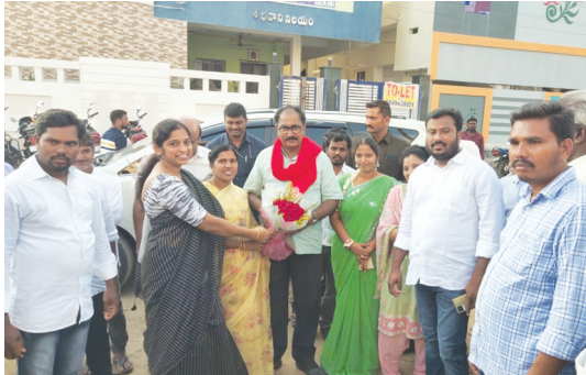
ఖమ్మం రూరల్, కెరటం న్యూస్