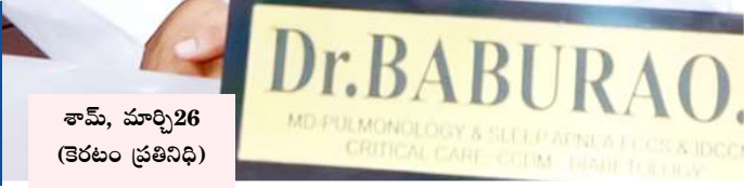
శామ్, మార్చి 26 (కెరటం ప్రతినీధి)