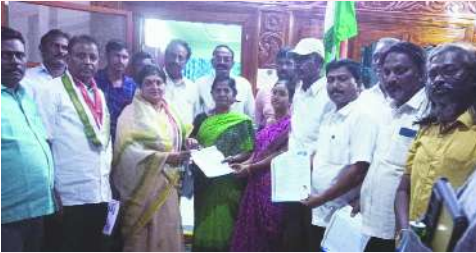
వసం నాగయ్య, కెరటం స్పాన్

మల్లు నందిని విక్రమార్కు జాలిముడి గ్రామంలో హాత్ సే హాత్ జోడో యాత్ర ప్రారంభం