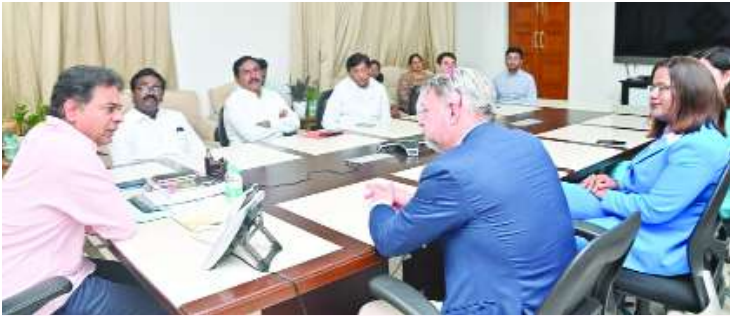
హైదరాబాద్ బ్యాంకో, కెరటం స్కూల్స్

ఫార్మా, గ్లోబల్ క్యాపబిలిటీ క్యాంపస్ కేంద్రం రంగంలో హైదరాబాద్ తన స్థానాన్ని మరింత సుస్థిరం చేసేలా మరో లైఫ్ సైన్స్ దిగ్గజ కంపెనీ శాండ్స్ తన గ్లోబల్ క్యాపబిలిటీ కేంద్రాన్ని హైదరాబాద్ నగరంలో ఏర్పాటు చేస్తున్నట్లు ప్రకటించింది. ఈ కేంద్రం ద్వారా కంపెనీ ప్రపంచవ్యాప్తంగా కొనసాగుతున్న తన కార్యకలాపాలకు నాణ్యత నిర్వహణ ని అందించనున్నట్లు తెలిపింది. ఈ గ్లోబల్ క్యాపబిలిటీ కేంద్రంలో తొలుత 800 మంది ఉద్యోగులు పనిచేస్తారని, తర్వాత దశలవారీగా వీరి సంఖ్యను 1800కు పెంచనున్నట్లు సంస్థ తెలిపింది.