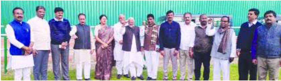
స్పృహిల్లీ, కెరటం స్పృహిల్లీ