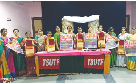
ఖమ్మం ఎడ్యుకేషన్, కెరటం స్కూల్స్