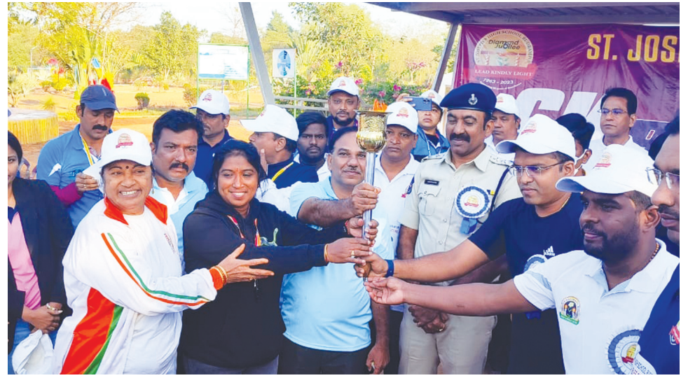
ఖమ్మం, కెరటం స్కూల్స్

సెయింట్ జోసెఫ్ హై స్కూల్ స్థాపించి 60 సంవత్సరాలు పూర్తయిన సందర్భంగా ఆదివారం నిర్వహించిన 63 రన్ విజయవంతమైనది. ఈ కార్యక్రమానికి ముఖ్య అతిథులుగా భద్రాద్రి కొత్తగూడెం జిల్లా ఎస్పీ