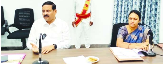
అదాలత్ రాజీపడటం వలన కక్షిదారులకు

భద్రాద్రి గుడెం జిల్లా కోర్ట్ లో ఫిబ్రవరి 11న జరిగే జాతీయ అదాలత్ లో ఎక్కువ కేసుల పరిష్కారం కోసం కృషి చేయాలని జిల్లా ప్రధాన న్యాయమూర్తి పి.చంద్రశేఖర ప్రసాద్ బుధవారం జిల్లా కోర్ట్ క్యాన్సలరీ హాల్ లో జరిగిన సమీక్ష సమావేశంలో తెలిపారు. ఇన్స్పెక్షన్ కంపెనీ ప్రతినిధులు తమ కేసులను లోక్ అదాలత్ లో రాజీమాధ్యం ద్వారా పరిష్కరించుకోవాలని సూచించారు. మోటార్ వాహన ప్రమాద బాధితుల కేసులలో కక్షిదారులకు న్యాయం జరగాలని సూచించారు. లోక్