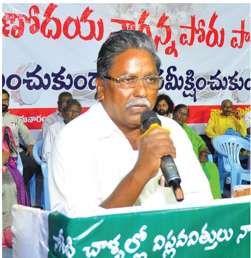
ఖమ్మం టౌన్, కెరటం స్కూల్