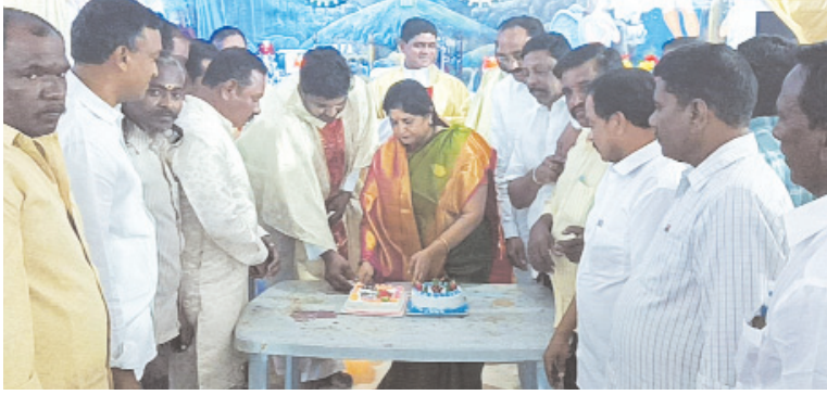
మధిర, కెరటం స్కూల్

విశుక్రీస్తు పుట్టిన రోజు క్రిస్మస్ ను పురస్కరించుకుని స్థానిక ఆర్.సీ.ఎం చర్చిలో జరిగిన ప్రత్యేక ప్రార్థనలో సీఎల్పీ లీడర్ మల్లు