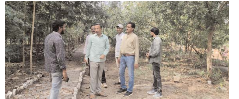
నేలకొండపల్లి, కెరటం స్టూన్

గ్రామపంచాయతీ ఆధ్వర్యంలో జాతీయ గ్రామీణ ఉపాధి హామీ పథకంలో భాగంగా ఏర్పాటు చేస్తున్న నర్సరీల నిర్వహణ పట్ల సర్పంచులు ప్రత్యేక శ్రద్ధ వహించాలని జెడ్పీ సీఈవో బి అప్పారావు ఆదేశించారు. మంగళవారం మండలంలోని నేలకొండపల్లి, అనాసాగరం, బోదులబండ గ్రామపంచాయతీలను ఆయన సందర్శించారు. ఈ సందర్భంగా ఆయా గ్రామాలలో ఉపాధి హామీ పథకంలో భాగంగా ఏర్పాటుచేసిన ప్లాంటేషన్లు, పల్లె ప్రకృతి వనం, నర్సరీలను సందర్శించారు. ఈ సందర్భంగా ఆయన మాట్లాడుతూ నర్సరీ పనులలో భాగంగా బ్యాగు ఫిల్లింగ్ పనులను అన్ని గ్రామపంచాయతీలలో శనివారం నాటికి పూర్తి చేయాలని అధికారులను ఆదేశించారు. బ్యాగులలో మట్టి నాణ్యతను పరిశీలించి తగు సూచనలు చేశారు. నర్సరీలను పంచాయతీ కార్యదర్శి క్షేత్ర సహాయకులు నిత్యం పరిశీలించాలన్నారు. నాణ్యమైన విత్తనాలను కొనుగోలు చేసి నాటించాలన్నారు. ఈ కార్యక్రమంలో ఎంపీటీసీ కే జమలారెడ్డి, గ్రామ పంచాయతీల సర్పంచులు, పంచాయతీ కార్యదర్శులు, సిబ్బంది పాల్గొన్నారు.