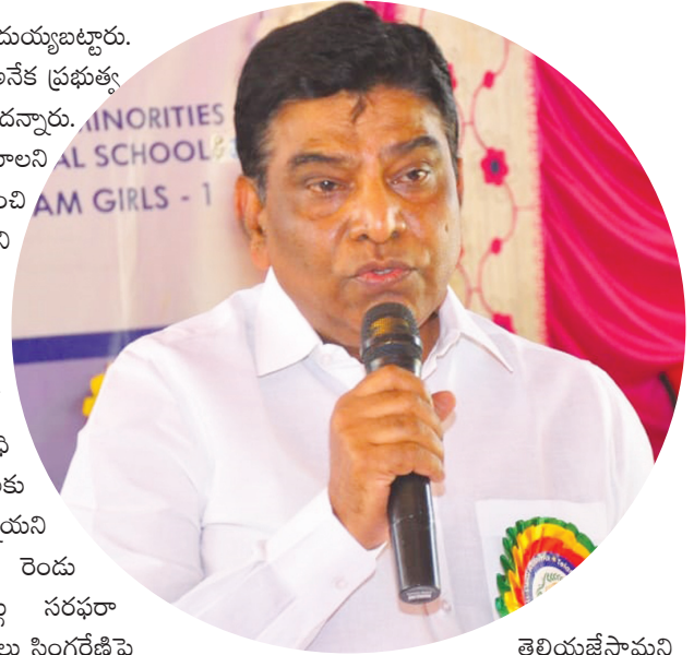
తెలియజేస్తామని అన్నారు. రాష్ట్రాన్ని ప్రోత్సహించకపోగా అంతులేని వివక్షత చూపిస్తూ రాష్ట్ర ప్రగతిని అడ్డుకుంటోందని నామ పేర్కొన్నారు. రాష్ట్రానికి చేసిన అన్యాయాలు, నిధుల నిలిపివేత, విభజన హామీల అమలులో వైఫల్యం, దివాలాకోరు రాజకీయాలు తదితర అంశాలపై పార్లమెంట్లో గర్జిస్తామని నామ స్పష్టం చేశారు.

కూడా లేకుండా అమ్ముకానికి పెట్టారని దుయ్యబట్టారు. సింగరేణి ఒక్కటే కాదు దేశ వ్యాప్తంగా అనేక ప్రభుత్వ సంస్థలను కేంద్రం అమ్ముకానికి పెట్టిందన్నారు. సింగరేణిని తెలంగాణాకే వదిలేయాలని డిమాండ్ చేశారు. సింగరేణికి సంబంధించి కేంద్రం వాటా 49 శాతమేనని, దానిని కూడా తెలంగాణానే తీసుకుంటుందని నామ అన్నారు. సీఎం చేసిన విజ్ఞప్తులను పరిగణలోకి తీసుకోకుండా సింగరేణి బ్లాకులను ప్రైవేటీకరించడం కరెక్ట్ కాదన్నారు. వేలాది మందికి జీవోనోపాధి కల్పిస్తున్న సింగరేణిని కార్పొరేట్ సంస్థలకు అప్పగించడం వెనుక అనుమానాలున్నాయని అన్నారు. సింగరేణి నుంచి దాదాపు రెండు వేలకు పైగా పరిశ్రమలకు బొగ్గు సరఫరా జరుగుతున్నదని, వేలాది మంది కార్మికులు సింగరేణిపై ప్రత్యక్షంగా, పరోక్షంగా ఆధారపడి జీవిస్తున్నారని, తెలంగాణ సమాజమంతా ఐక్యంగా కేంద్రం వైఖరిని ఎండగడుతుందని అన్నారు. తెలంగాణకు అడుగుడుగునా అన్యాయం చేస్తూ కక్షపూరితంగా వ్యవహరిస్తున్న కేంద్రాన్ని తెలంగాణ సమాజం నహించదన్నారు. తెలంగాణ వ్యతిరేక విధానాలపై పార్లమెంట్లో కేంద్రాన్ని నిలదీసి, దేశమంతటికీ