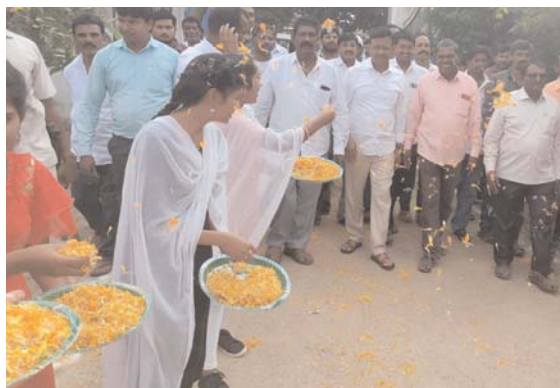
తిరుమలాయపాలెం కెరటం స్టూన్