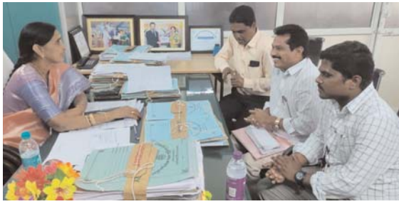
భద్రాచలం, కెరటం స్టూన్

గత నాలుగు సంవత్సరాల క్రితం గిరిజన సంక్షేమ శాఖలో పనిచేయుచున్న సిఆర్టీ లను ఐటిడిఎ అధికారులు తొలగించడం జరిగింది. అయితే టీఎస్ యుటిఎఫ్ గా నాలుగు సంవత్సరాలుగా అనేక పోరాటాలు ప్రాతినిధ్యాల చేయడం మూలంగా ఆగస్టు నెలలో ఎమ్మెల్సీ నర్సిరెడ్డికి సిఆర్టీల సంఘం రాతపూర్వకంగా ఉద్యోగాలు ఇప్పించాలని