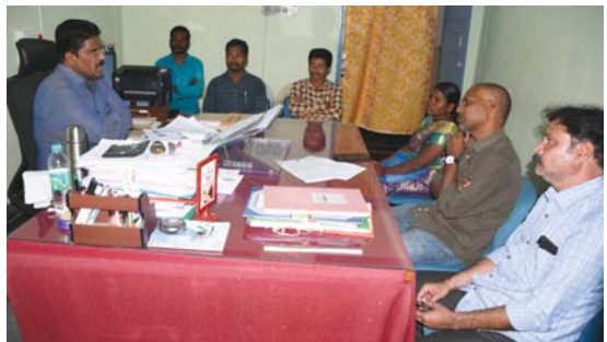
భద్రాచలం కెరటం స్యూస్