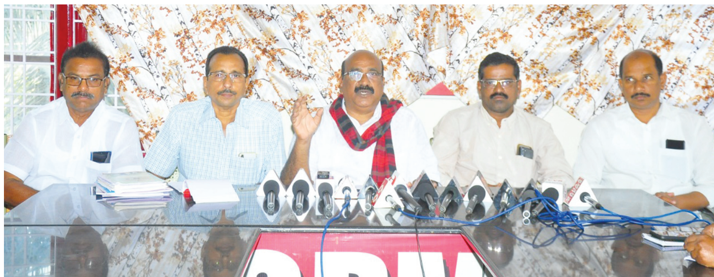
ఖమ్మం టౌన్, కెరటం స్కూల్స్