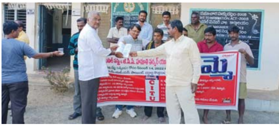
భద్రాచలం కెరటం స్యూస్

2022 ఆగస్టు నెలలో జిసిసి సివిల్ సమ్మె హమాలీ కార్మికుల దిగుమతి ఎగుమతి రేట్లు పెంచుతూ రాష్ట్ర ప్రభుత్వం ఒప్పందం చేసుకుంది ఈ ఒప్పందం అమలుకు సంబంధించి జీవో ఇవ్వకుండా నాలుగు నెలలు పాటు జరిగిన జాబియానికి నిరసనగా సిబి యు ఆధ్వర్యంలో జిసిసి సివిల్ సమ్మె హమాలీలో పని చేస్తున్న ఇతర కార్మిక సంఘాలను కలుపుకొని జాయింట్ యాక్షన్ కమిటీగా గత 11 రోజులుగా సమ్మె నిర్వహిస్తున్నారు. కార్మికులు చేపట్టిన సమ్మెకు ప్రభుత్వం దిగివచ్చి యూనియన్ల నాయకులతో చర్చించి 24 12 2022న ప్రభుత్వం జీవో నెంబర్ 12 ను విడుదల చేసింది. అవాలి కార్మికులకు ఎగుమతి దిగుమతి చార్జీలు కింటాకు 22 రూపాయల నుంచి 26 రూపాయలకు యూనిఫామ్ కుట్టుకూలి వెయ్యి రూపాయలు నుండి 1300 కు దసరా పండుగ ఇచ్చే స్టీల్ 700 నుండి 800 కు దసరా పండుగ సందర్భంగా ఇన్వెంటరీ 5500 నుండి 6000 రూపాయలకు పెంచుతూ జరిగిన ఒప్పందాన్ని అమలుపరుచుటకు జీవో నెంబర్ 27 లో మార్గదర్శకాలను విడుదల చేయడం జరిగింది. ఈ ఒప్పందం 2022 జనవరి నుండి అమలు కావలసి ఉన్నందున జనవరి