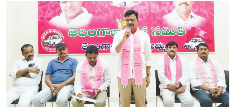
ఖమ్మం, కెరటం న్యూస్