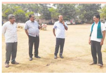
ఖమ్మం, కెరటం స్యూస్ వ్యవసాయ కార్మిక సంఘం రాష్ట్ర మహాసభల సందర్భంగా ఈనెల 29న ఖమ్మం ప్రభుత్వ డిగ్రీ కళాశాల ఎస్ఆర్ఆండ్ బీజీఎన్ఆర్ లో నిర్వహించే బహిరంగ సభాస్థలిని సీపీఐ (ఎం) నేతలు శుక్రవారం పరిశీలించారు.