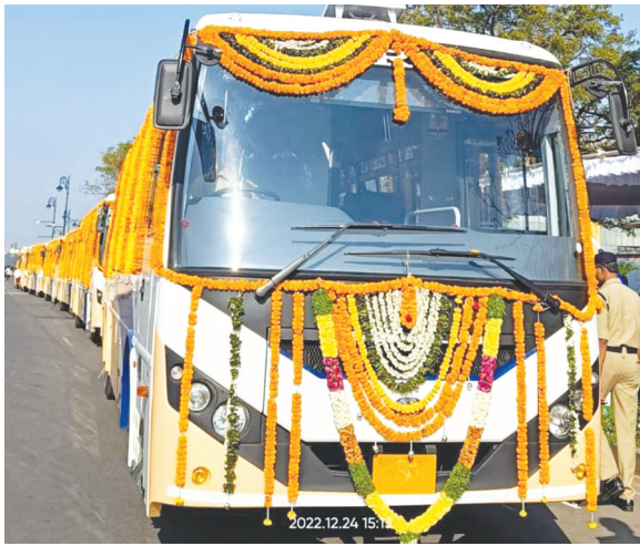
మొదటి పేజీ తరువాయి...

టీ.ఎస్.ఆర్టీసీ పరిరక్షణ కోసం రాష్ట్ర ముఖ్యమంత్రి కేసీఆర్ గారు చిత్తశుద్ధితో కృషి చేయడం జరుగుతోందన్నారు. ప్రజారవాణా ఆర్టీసీ తోనే సాధ్యం, ప్రగతి రథాలు ఆర్టీసీ తోనే సాధ్యం అని కేసీఆర్ గారు నమ్మి వారు కృషి చేస్తున్నారని అని మంత్రి పువ్వాడ తెలిపారు. కరోనా కాలంలో ఆర్టీసీ ఇబ్బందులను ఎదుర్కొందని, ఆ సమయంలో దాదాపు 1800 కోట్ల సుంచి 2 వేల కోట్ల వరకు ఆదాయం కోల్పోయిందని మంత్రి వివరించారు. ప్రస్తుతం రవాణా రంగంలో నెలకొన్న పోటీని తట్టుకుని ముందుకు వెళ్లడంలో తెలంగాణ ప్రభుత్వ సహకారంతో యాజమాన్యం అనేక ప్రయత్నాలు చేస్తోందని ఆయనకితాబు ఇచ్చారు. ఎం.డి గా వి.సి.సజ్జనర్, సంస్థ చైర్మన్ బాజిరెడ్డి గోవర్ధన్ బాధ్యతలు చేపట్టిన తరువాత సంస్థను అభ్యున్నతి వైపుగా తీసుకెళ్లేందుకు పలు చాలెంజ్లను చేపట్టి పూర్వోత్పాదక కార్యచరణతో ముందుకెళ్ళా ఆదాయం పెంపు కోసం తమ వంతు ప్రయత్నం చేయడం ఆభినందనీయమన్నారు. వ్యక్తిగత వాహనాల వినియోగం తగ్గించుకుని ప్రజా రవాణా రంగాన్ని ప్రోత్సహించాల్సిన అవసరం ఎంతైనా ఉందని మంత్రి పువ్వాడ సూచించారు. సీఎం కేసీఆర్ చొరవతో ఎలక్ట్రిక్ బస్సులు కూడా త్వరలో రాబోతున్నాయని, కొత్త బస్సులు రావడంతో మొత్తం 10వేల బస్సులతో నాటి రోజులు మళ్ళీ పునరావృతం కాబోతుందన్నారు. ఆర్టీసీని వ్యాపార దృక్పథంతో చూడకుండా సేవా భావంగా చూడాలని వారు కోరారు. బస్సుల్లో ప్రయాణించి సంస్థను ఆదరించడానికి అందరూ తమవంతు కృషి చేయాలని, అప్పుడే సంస్థ పురోభివృద్ధి సాధించగలదన్నారు. ముఖ్యమంత్రి