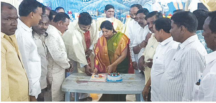
మధిర, కెరటం స్కూల్స్

ఏనుకీస్తు పుట్టిన రోజు క్రిస్మస్ ను పురస్కరించుకుని స్థానిక ఆర్.సి.ఎం చర్చిలో జరిగిన ప్రత్యేక ప్రార్థనలో సీఎల్పీ లీడర్ మల్లు