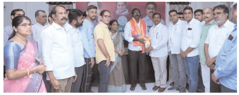
ఖమ్మం బ్యూరో, కెరటం న్యూస్