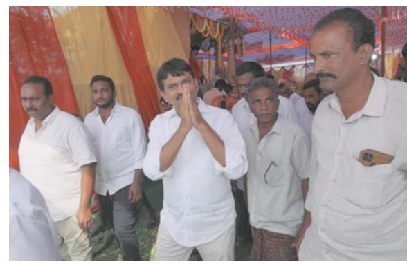
ఖమ్మం బ్యూరో, కెరటం న్యూస్

ఖమ్మం జిల్లా మాజీ పార్లమెంటు సభ్యులు పొంగులేటి శ్రీనివాసరెడ్డి మధిర పట్టణంలో పర్యటించారు. పర్యటనలో భాగంగా రెడ్డి గార్డెన్స్ నందు జరుగుతున్న బెజవాడ రవి