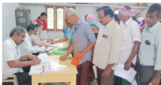
వైరా, కెరటం న్యూస్