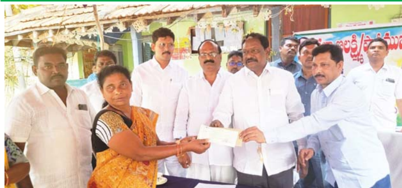
భద్రాచలం కెరటం న్యూస్