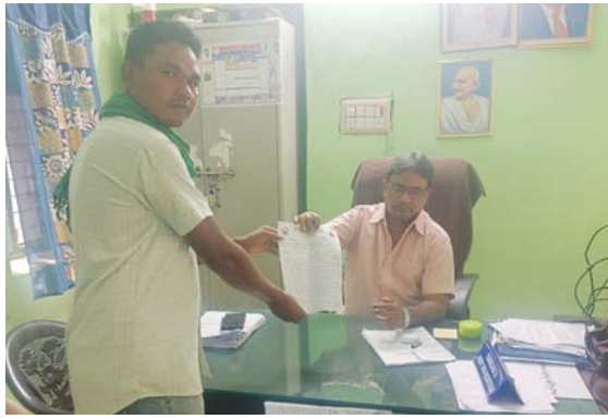
దుమ్ముగూడెం, నవంబర్ 9, కెరటం న్యూస్

మండలంలో అనేక చోట్ల 1/70 చట్టానికి విరుద్ధంగా కొందరు గిరిజనేతరులు యథేచ్ఛగా అక్రమ షాపింగ్ కాంప్లెక్స్ ల నిర్మాణాలు చేపడుతున్నారని, ఈ అక్రమ నిర్మాణాలను తక్షణం నిలిపివేసి అక్రమ నిర్మాణాలు చేపడుతున్న వారిపై ఎల్ టి ఆర్ కేసులు నమోదు చెయ్యాలని ఏఎస్సీ డివిజన్ అధ్యక్షులు సొంది మల్లదొర అధికారులను