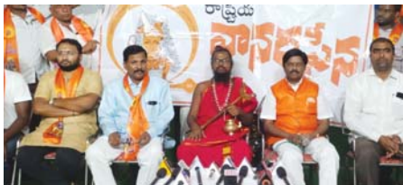
భద్రాచలం కెరటం న్యూస్

ఆంధ్రప్రదేశ్ లోని అల్లూరి జిల్లా పురుషోత్తపట్నం లో భద్రాద్రి రామయ్య కు వున్న 917 ఎకరాల భూములను రక్షించి తీరుతామని ప్రకటించిన రాష్ట్రీయ వోనార సేన అధ్యక్షులు. గత కొన్నేళ్లుగా ఆక్రమణకు గురైన 917 ఎకరాల ఆలయ భూములపై