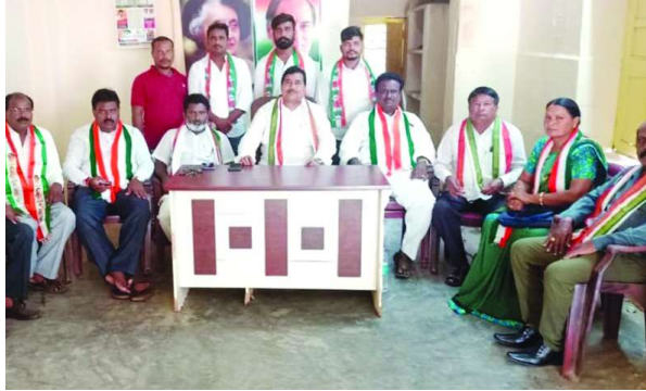
శామ్, నవంబర్ 23 (రెరటం ప్రతినధి)