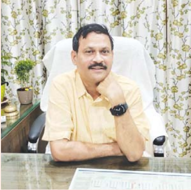
డబ్బులు ఆదా అవుతాయని కక్షిదారులను కోరారు.