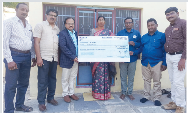
వనం నాగయ్య (కెరటం స్కూల్స్)

స్టార్ హెల్త్ కష్టమర్ కుటుంబానికి ఆర్థిక దిమా