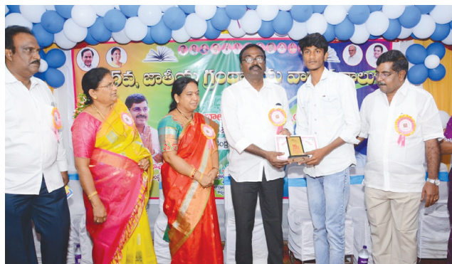
ఖమ్మం టౌన్, కెరటం స్కూల్స్