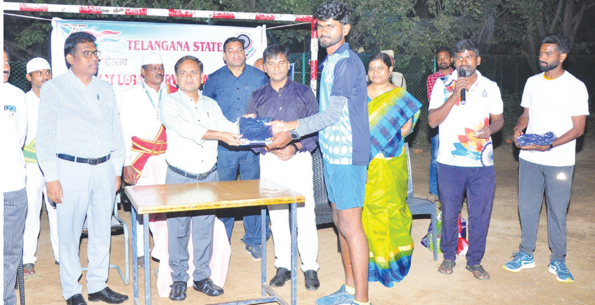
ఖమ్మం బ్యారో, కెరటం స్కూల్స్

సామాజిక సేవలో ఖమ్మంలోని శ్రీలక్ష్మీ మాధవ హాస్పిటల్ ముందడుగు