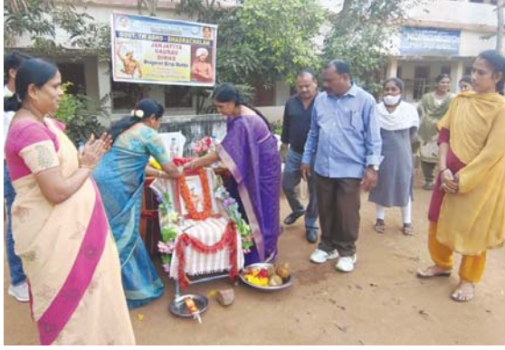
భద్రాచలం, కెరటం స్టూన్స్

జన్ జాతీయ గౌరవ దినం దినోత్సవం సందర్భంగా భద్రాచలంలోని స్వాతంత్ర్య సమరయోధులు మరియు పద్మశ్రీ అవార్డు గ్రహీతలకు సన్మానం తో పాటు వారం రోజులు పాటు ప్రతి ఆశ్రమం పాఠశాలలో ప్రత్యేక కార్యక్రమాలు నిర్వహించడం జరుగుతుందని