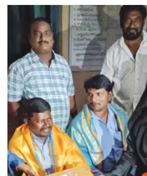
ఖమ్మం