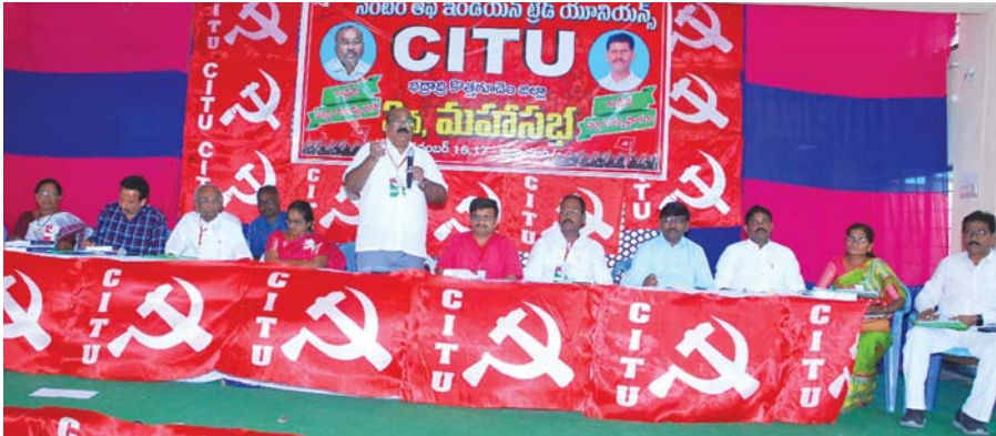
భద్రాచలం, కెరటం స్టూన్

ఉత్సాహపూరితంగా ప్రారంభమైన సిఐటియు జిల్లా మూడవ మహాసభ