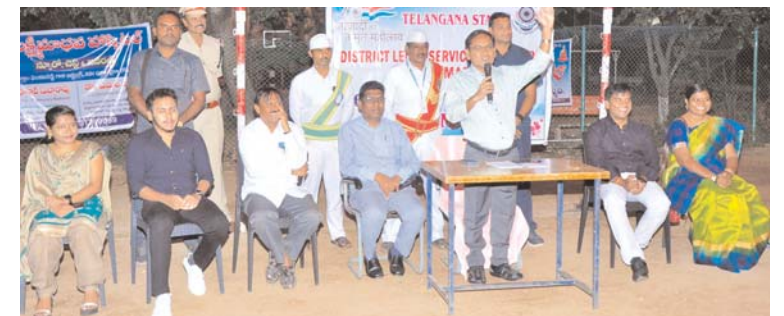
ఖమ్మం జ్యూరీ, కెరటం స్కూల్స్