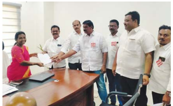
ఖమ్మం, నవంబర్ 17, కెరటం స్కూల్స్