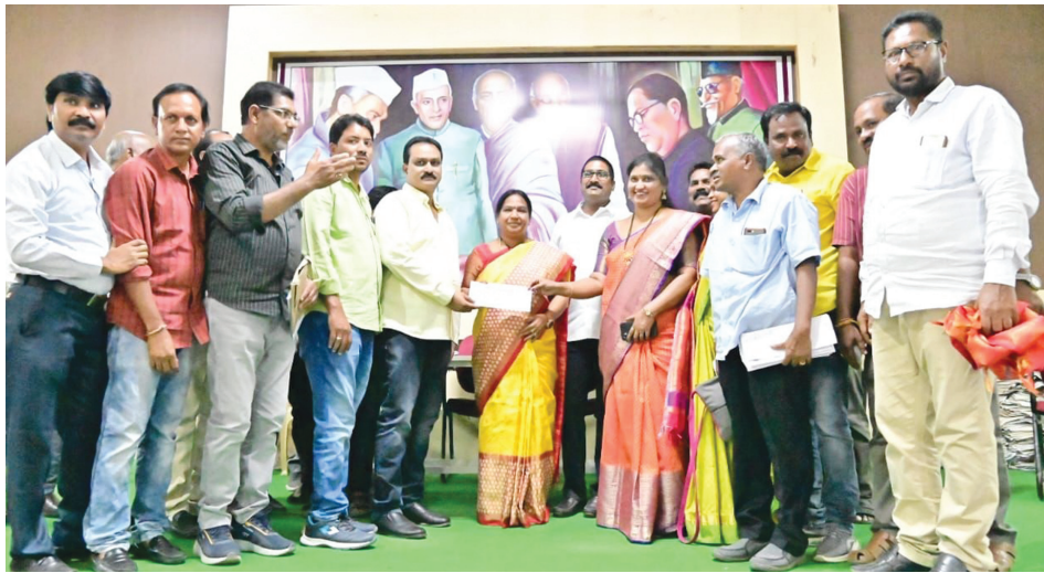
ఖమ్మం టౌన్, కెరటం స్కూల్స్