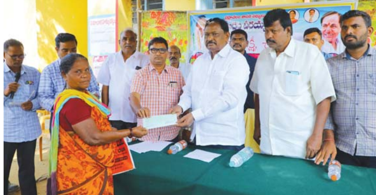
దుమ్ముగూడెం సవంబర్ 15 కెరటం స్యూస్

దుమ్ముగూడెం మండలంలో మంగళవారం కల్యాణ లక్ష్మి