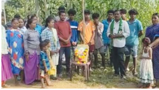
దుమ్ముగూడెం సవంబర్ 15 కెరటం స్యూస్